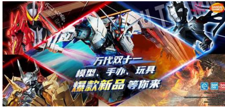
TMALL「BANDAI 公式旗艦店」のプロモーション用ポスター