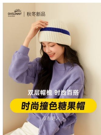
OHSUNNY のプロモーション用ポスター

効果的なデジタルマーケティングにより、トランスコスモスチャイナは OHSUNNY のダブルイレブンのプレセールス期間におけるカテゴリー(アパレル・アクセサリ)の TOP、そしてダブルイレブン全体での売上が前年比 580%増、累積支出 200%以上、ROI30%以上の伸長に貢献しました。