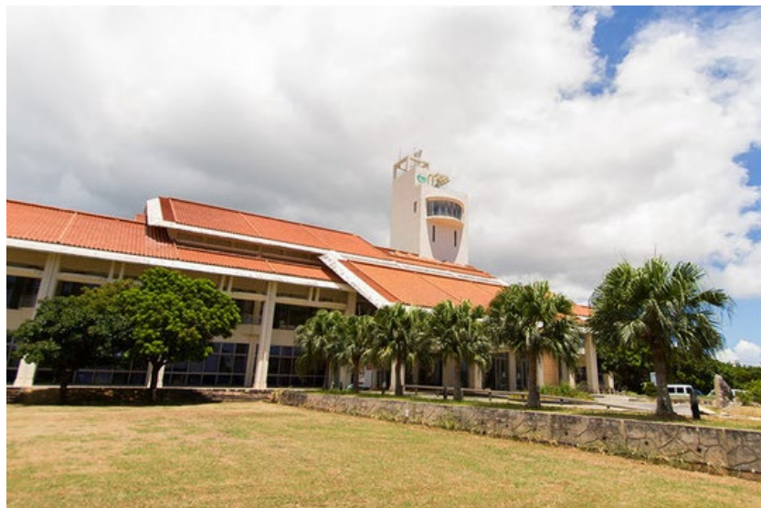
小規模型 BPO センターを開設する宮古島 ICT 交流センター